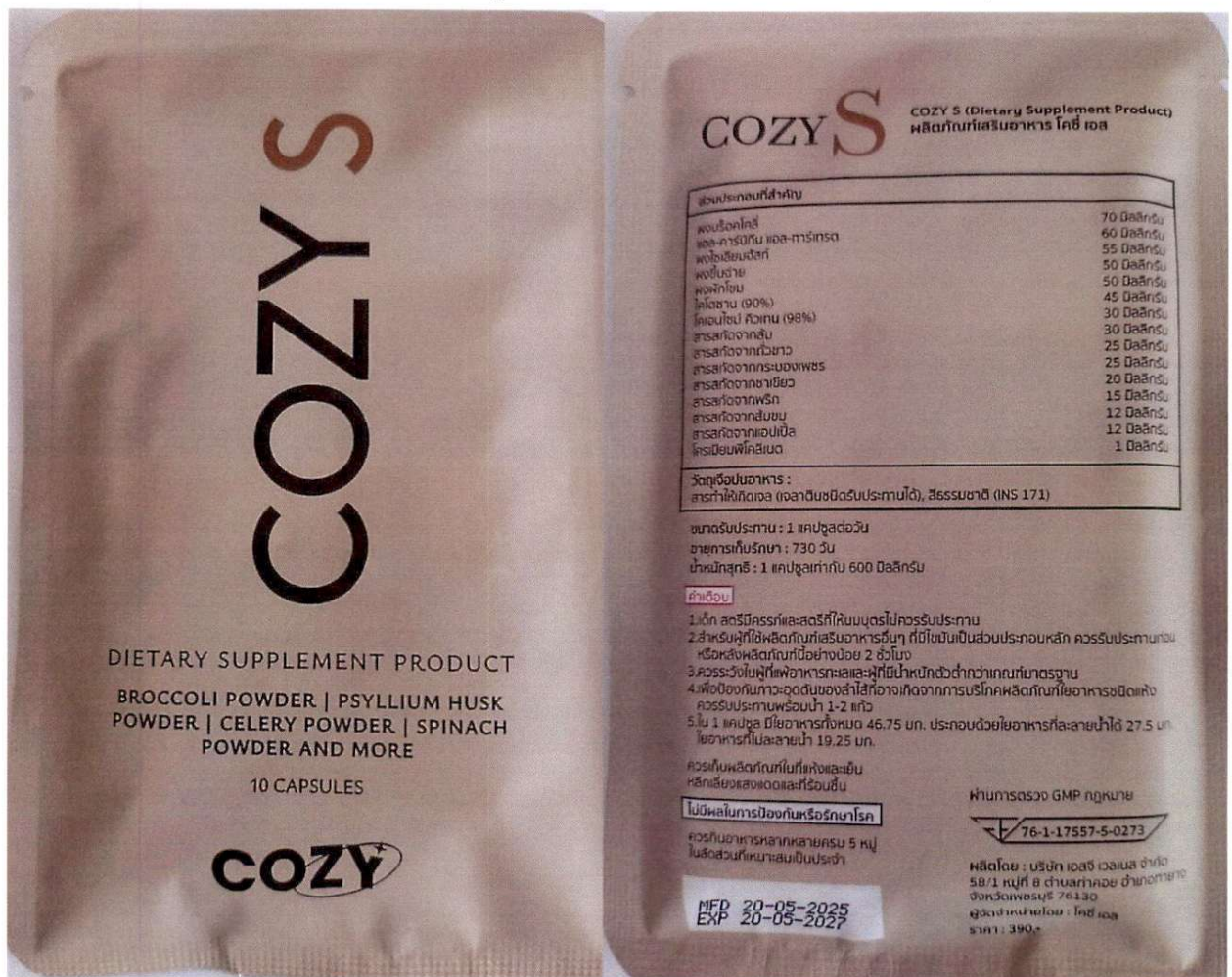
ภาพถ่ายผลิตภัณฑ์

ผลิตภัณฑ์ฉลากระบุ “ผลิตภัณฑ์เสริมอาหาร โคซี่ เอส ออย. 76-1-17557-5-0273 MFD 20-05-2025 EXP 20-05-2027 ผลิตโดย: บริษัท เอสจี เวลเนส จำกัด 58/1 หมู่ที่ 8 ตำบลท่าคอย อำเภอท่ายาง จังหวัดเพชรบุรี 76130 จัดจำหน่ายโดย โคซี่ เอส...” เป็นต้น ซึ่งเก็บจากสถานที่จำหน่ายอาหาร ณ บ้านเลขที่ ๗๗/๔๖๐ ซอยพหลโยธิน ๕๔/๑ แยก ๔ (หมู่บ้านชลลดา ซอย ๑๒) แขวงสายไหม เขตสายไหม กรุงเทพมหานคร